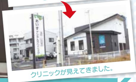
クリニックが見えてきました。