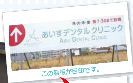
この看板が目印です。